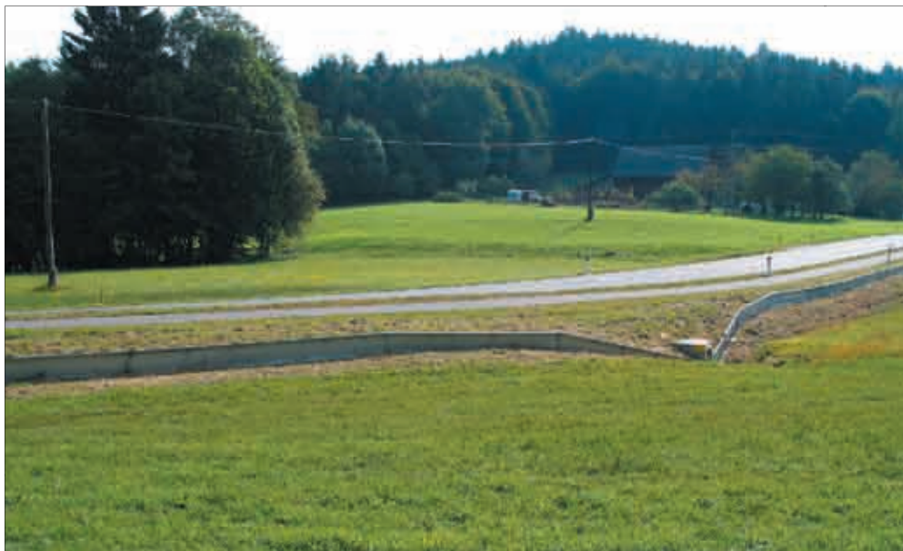
Tunnel-Leit-Anlage im Bereich Wukschteich, Gemeinde Schiefeling am See.

Die Anlagen müssen unterschiedlichsten Witterungsbedingungen standhalten und ihre Funktionsfähigkeit für sämtliche Altersstufen aller Amphibienarten gleichermaßen erfüllen. Diese spezifischen Anforderungen bedingen einen relativ hohen Kostenaufwand, weshalb die Umsetzung dieser Schutzmaßnahme in der Praxis bisher nur gelegentlich erfolgte.