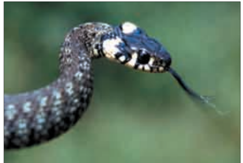
Grasfrosch-Kaulquappen ( Rana temporaria ) und einer ihrer Fressfeinde, eine Ringelnatter ( Natrix natrix ).

wodurch im Herbst erneut eine Wanderung stattfindet. Diese Herbstwanderung ist nicht so intensiv und zielgerichtet wie die Frühjahrswanderung.