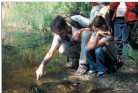
Amphibienexkursion ans Lanzendorfer Moor.

Jeder Fund, welcher der Arge NATURSCHUTZ gemeldet wird, wird in der herpetologischen Datenbank Kärntens gespeichert. Je mehr Daten vorhanden sind, umso besser können bestehende Schutzaktionen und auch zukünftige Maßnahmen koordiniert werden.