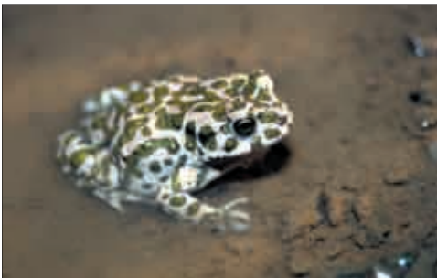
Wechselkröte ( Bufo viridis ) (Foto: Karina Smole-Wiener).

Bei der äußeren Befruchtung legen die Weibchen ihre Eier in Ballen (Frösche), Klumpen (Unken) oder Schnüren (Kröten) ab. Ihre Larven, die Kaulquappen, leben bis zu ihrer Umwandlung im Wasser. Im Sommer verlassen sie als fertig entwickelte Tiere oft zu Tausenden das Gewässer.