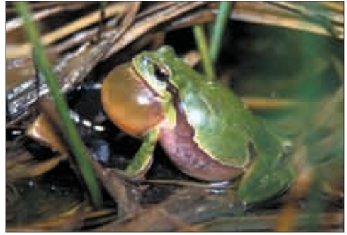
Rufender Laubfrosch ( Hyla arborea ).

Die Hinterbeine sind viel länger ausgebildet als die Vorderbeine, sie dienen in der Regel der springenden Fortbewegung. Spannhäute zwischen den Fingern und Zehen erleichtern das Schwimmen. Bei den baumbewohnenden Arten