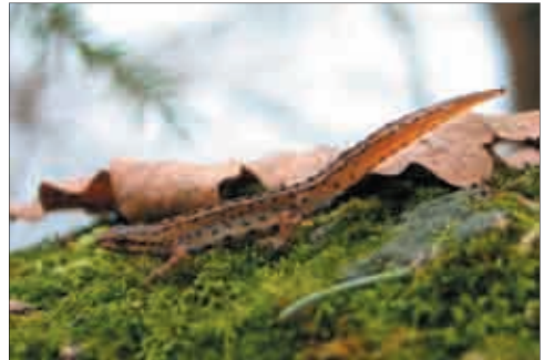
Teichmolch-Männchen ( Triturus vulgaris ).

Während die Salamander einen drehrunden Schwanz besitzen, ist der Schwanz der Molche seitlich abgeplattet.