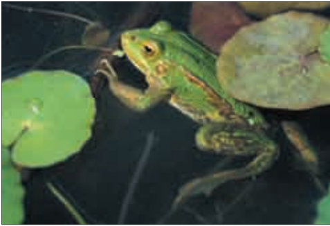
Paarungswilliger Balkan-Moorfrosch ( Rana arvalis wolterstorffi ) und Grünfrosch ( Rana sp. ).

Die Männchen der Froschlurche treffen meist zuerst am Laichplatz ein und locken die Weibchen akustisch durch artspezifische Gesänge oder Rufe (Froschkonzert) an. Manche Arten weisen außerdem zur Paarungszeit besonders auffällige Farben auf, wie zum Beispiel die himmelblaue Färbung des Balkan-Moorfrosches. Die Froschlurchmännchen klammern sich an den Weibchen fest. In dieser Paarungshaltung gibt das Weibchen die Eier ins Wasser ab, die gleichzeitig vom Männchen besamt werden.