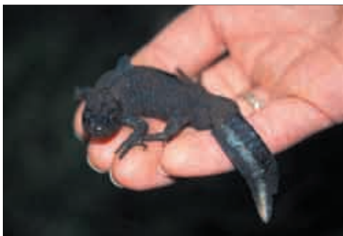
Um dem Straßentod von Amphibien entgegen zu wirken, werden verschiedene Schutzbemühungen unternommen: hier ein geretteter Alpen-Kammolch ( Triturus carnifex ).

Eine überaus kostengünstige und effiziente Methode zum Schutz wandernder Amphibien ist die zeitweilige Sperre der betroffenen Straße für den Verkehr. Dies betrifft vorrangig die Zeit der Frühjahrswanderung (März/April). Da die Amphibien überwiegend nachtaktiv sind, ist es wichtig, den Verkehr in der Zeit zwischen etwa 19 Uhr abends und 6 Uhr Früh zu vermeiden. Wird der Verkehr in dieser Zeit umgeleitet, können die Tiere gefahrlos das Straßenstück auf ihrem Weg zum Laichgewässer überqueren. Mit etwas Rücksichtnahme und Verständnis der Autofahrer können ohne großen finanziellen und technischen Aufwand viele der gefährdeten Amphibien gerettet und damit ein wichtiger Beitrag zur Erhaltung der heimischen Tierwelt geleistet werden.