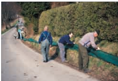
Aufbau eines Amphibienzaunes aus Kunststoffgeflecht (Foto: Karina Smole-Wiener).

Zu Beginn des Jahres 2006 waren 150 Amphibienwanderstrecken an Kärntens Straßen bekannt (siehe auch Übersichtskarte, Seiten 16/17), davon wurden 2005 an 94 Schutzmaßnahmen durchgeführt. Dabei waren landesweit Amphibienschutzzäune mit einer Gesamtlänge von 42 km im Einsatz. Die mühevollen Arbeit des jährlichen Auf- und Abbaus erfolgt dankenswerter Weise überwiegend durch zahlreiche Mitarbeiter der Straßenmeistereien und Gemeinden, die tägliche Zaunbetreuung wird von Privatpersonen durchgeführt. Dieses beachtliche Engagement freiwilliger Helfer führt zu dem beeindruckenden Ergebnis von 60.000 bis 85.000 geretteten Amphibien jährlich.