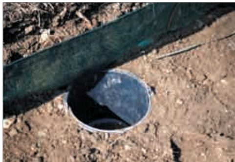
Eingegrabener Kübel als Fangbehälter am Schutzzaun (Foto: Karina Smole-Wiener).