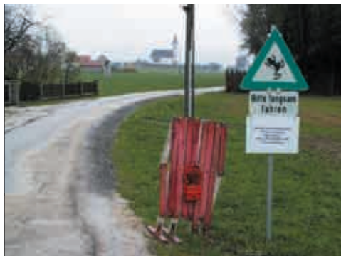
Nächtliche Straßensperre bei Magersdorf, Lavanttal.

dem entgegenzuwirken und deren Überleben zu sichern, müssen an Straßenabschnitten, die Amphibienwanderrouen queren, entsprechende Schutzmaßnahmen ergriffen werden.