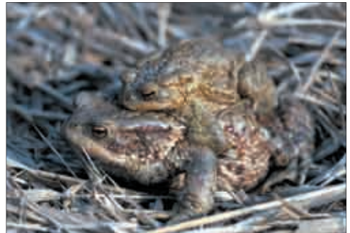
Erdkröten-Pärchen ( Bufo bufo ) auf dem Weg zum Laichgewässer.

stehende Gewässer wie Tümpel und Teiche werden von den meisten Arten bevorzugt. Einige Arten favorisieren größere Laichgewässer wie Weiher und Uferstellen von Seen. In erster Linie gilt dies für den Seefrosch, aber auch für Wasserfrosch und Erdkröte. Gelbbauchunken bevorzugen ausgesprochen kleine Laichgewässer wie Tümpel, Wagenspuren und Pfützen. Der Feuersalamander setzt seine Larven in ruhigen Abschnitten von Waldbächen ab.