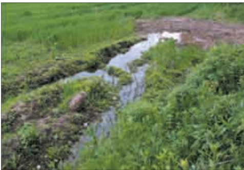
Wassergefüllte Traktorspuren als Laichgewässer der Gelbbauchunke (Foto: Karina Smole-Wiener).

Anstelle von Einzelgewässern wird die Anlage von mehreren Gewässern unterschiedlicher Ausstattung den verschiedenen Ansprüchen der Amphibienarten an das Laichgewässer besser gerecht. Die Schaffung mehrerer Gewässer, die sich hinsichtlich Größe, Tiefe, Bewuchs, Dauer der Wasserführung und Alter bzw.