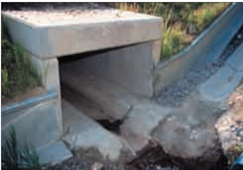
Tunnel-Leitanlage im Bereich Wukschteich in Schief- ling am See.

Damit eine Tunnel-Leit-Anlage von den Tieren angenommen und genutzt wird, sind mehrere Ausführungskriterien wesentlich, wie z. B. die Mindestgröße von 100 cm Breite und 60 cm