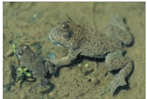
Gelbbauchunke ( Bombina variegata ).