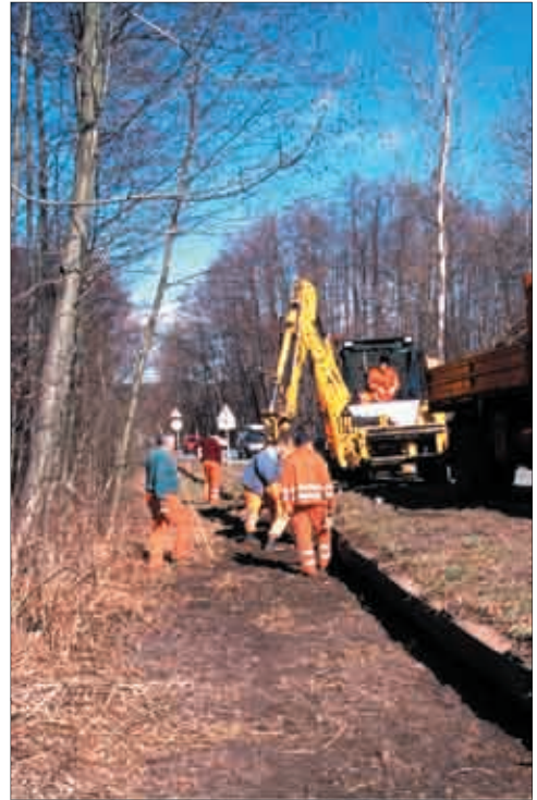
Pflegemaßnahmen an einer Leitwand (Foto: Karina Smole-Wiener).