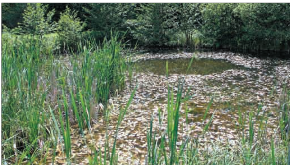
Verlandender Teich mit üppiger Wasservegetation.

So bereichern z. B. neu angelegte Hecken und Gebüschgruppen mit heimischen Gehölzen, feuchte Gräben, wassergefüllte Radspuren, Totholz- und Steinhäufen die vielerorts eintönige, ausgeräumte Landschaft. Selbst kleinräumige Strukturen wie Komposthäufen oder auch ein „wildes“ Eck im Hausgarten bieten den Amphibien wichtige Unterschlupfmöglichkeiten.