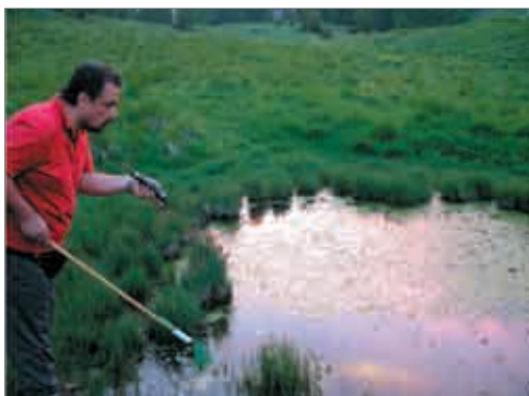
Monitoraggio presso una pozza alpina a Sella Somdogna - foto Stefano Fabian.

2. Il secondo obiettivo riguarda lo studio morfogenetico di alcune popolazioni di Rane verdi del Friuli Venezia Giulia. La ricerca si propone di chiarire quali siano i sistemi ibridogenetici utilizzati da questi animali nell'Italia nord-orientale, con il fine di utilizzare le rane verdi come bioindicatori di qualità ambientale.