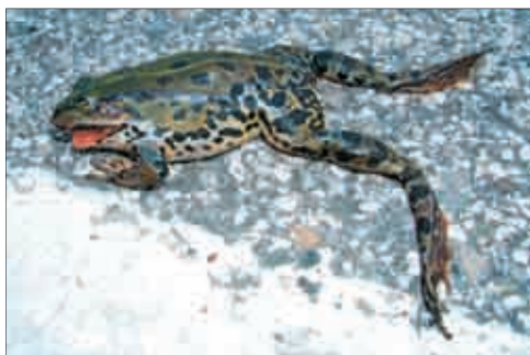
Rana kl. esculenta investita presso Biotopo Risorgive di Flambro (UD) - foto L. Lapini.

Uno dei principali effetti di questo impatto si traduce nella frammentazione delle comunità di molte specie animali. Si tratta in genere di entità poco mobili e fortemente legate al substrato,