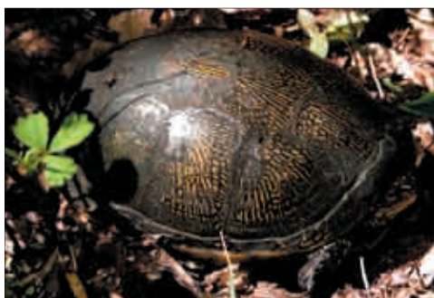
Testuggine palustre (Emys orbicularis) fotografata presso i boschi umidi di Muzzana del Turgnano (UD) - foto Stefano Fabian.

( Pelobates fuscus insubricus ) impreziosiscono ulteriormente il quadro complessivo, che risulta straordinario anche per abbondanti presenze europeo-orientali, dinariche o illirico-balcaniche. In diverse zone della regione sono infatti piuttosto frequenti i ramarri orientali ( Lacerta viridis ), gli algiroidi magnifici ( Algyroides nigropunctatus ), le lucertole di Melisello ( Podarcis melisellensis ), le lucertole di Horvath ( Iberolacerta horvathi ) e le vipere dal corno ( Vipera ammodytes ).