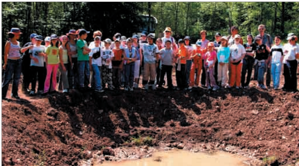
Sopralluogo di una scolaresca presso le pozze ripristinate a Plan di Tapou - Lusevera (UD), maggio 05.

contattare: central Director: Augusto Viola Adviser Stefano Fabian Comune di Udine Museo Friulano di Storia Naturale Adviser: Luca Lapini