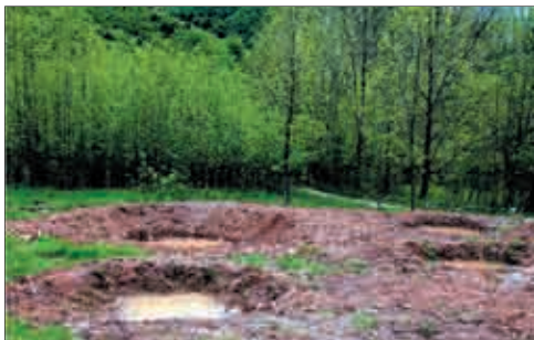
Ripristino di antichi abbeveratoi presso Plan di Tapou - Lusevera (UD) - foto Stefano Fabian.

importante iniziativa. I dati sono stati trasmessi ai partner capofila del progetto internazionale che stanno provvedendo ad elaborare una mappa di distribuzione dei corridoi di migrazione riproduttiva a rischio nei territori dell'intero distretto di Alpe-Adria (Italia-Austria-Slovenia). Ciò servirà a sviluppare iniziative coordinate e concertate fra i diversi paesi per la salvaguardia transfrontaliera delle popolazioni di anfibii.