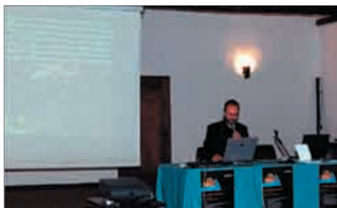
Partecipazione al convegno - Si fa presto a dire Rana - organizzato a Polcenigo dalla Provincia di Pordenone.

Per questo motivo i problemi di conservazione di questi animali e in particolare degli anfibi (la classe di vertebrati più minacciata a livello mondiale) sono stati posti al centro di una serie iniziative di studio, divulgazione e conservazione intraprese dalla Regione Friuli Venezia Giulia nell'ambito di uno specifico Progetto Intereg