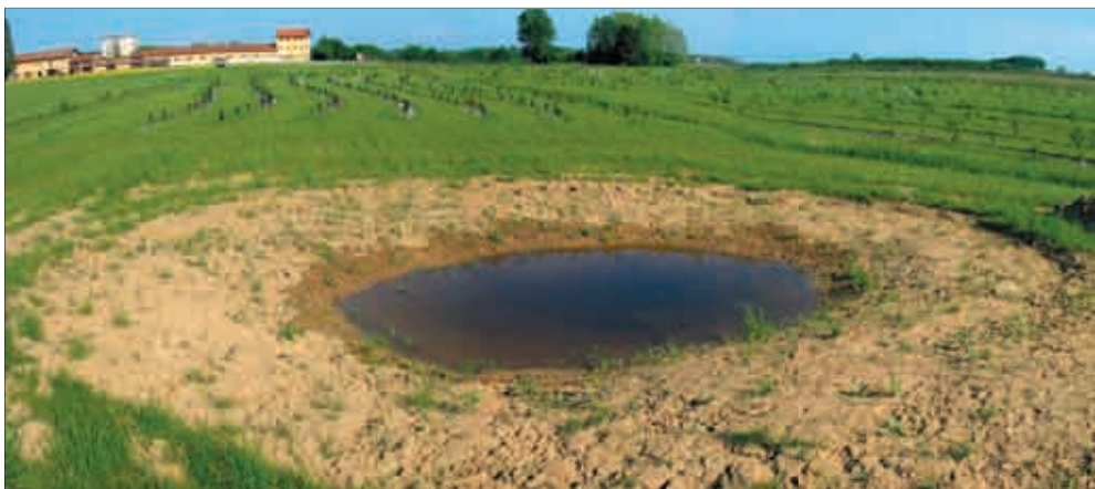
Panoramica della pozza impermeabilizzata con "Bentomat" a Palazzolo dello Stella (UD) - foto Sergio Cavan.

lizzazione di due interventi pilota finalizzati alla creazione e al ripristino di alcuni siti riproduttivi per anfibii in due aree (zona carsica di montagna e bassa pianura friulana) di particolare fragilità e di grande significato ecologico ed ambientale. Tali interventi assumono una triplice valenza: da una parte essi hanno permesso di raggiungere un concreto obiettivo di carattere conservazionistico con riflessi positivi sulla sensibilizzazione dell'opinione pubblica rispetto ai problemi legati alla conservazione delle specie più vulnerabili, dall'altra permetteranno di testare a livello locale e nel medio-lungo periodo alcune modalità di intervento già utilizzate sul territorio nazionale e regionale. Ciò anche al fine di confrontarle con l'utilizzo di tecniche e materiali di impermeabilizzazione da considerarsi per certi versi inediti ed innovativi. A tale proposito si valuteranno i risultati di 7 diverse modalità di intervento ottenute combinando in modo differente materiali e metodologie in due contesti ambientali con caratteristiche diametralmente opposte essendo diversamente condizionati dalla differente natura del suolo e del sottosuolo, del regime climatico e pluviometrico, dalla presenza o meno di fattori di disturbo molto diversi (rischi di