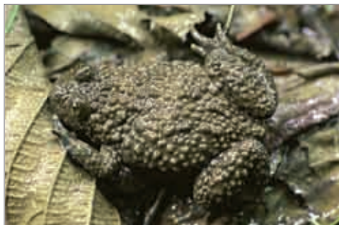
Bombina variegata Casasola Frisanco (PN) - foto L. Dreon.

Le enigmatiche segnalazioni di popolazioni a margine d'areale di pelobate padano