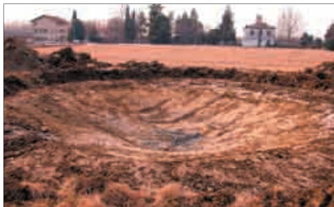
Scavo di una pozza per anfibì a scopo sperimentale e didattico a Palazzolo della Stella vicino ai boschi umidi di Muzzana (UD), marzo 2005.

inquinamento biologico per la presenza di vicini corsi d'acqua piuttosto che per l'attività di scarificazione sul fondo delle pozze da parte delle specie selvatiche come ad esempio i cinghiali), dal diverso livello di accessibilità e di facilità di esecuzione degli interventi. Le verifiche permetteranno di stilare un bilancio del miglior rapporto costi/benefici per le singole aree e di renderlo disponibile per l'attuazione di analoghe iniziative di conservazione.