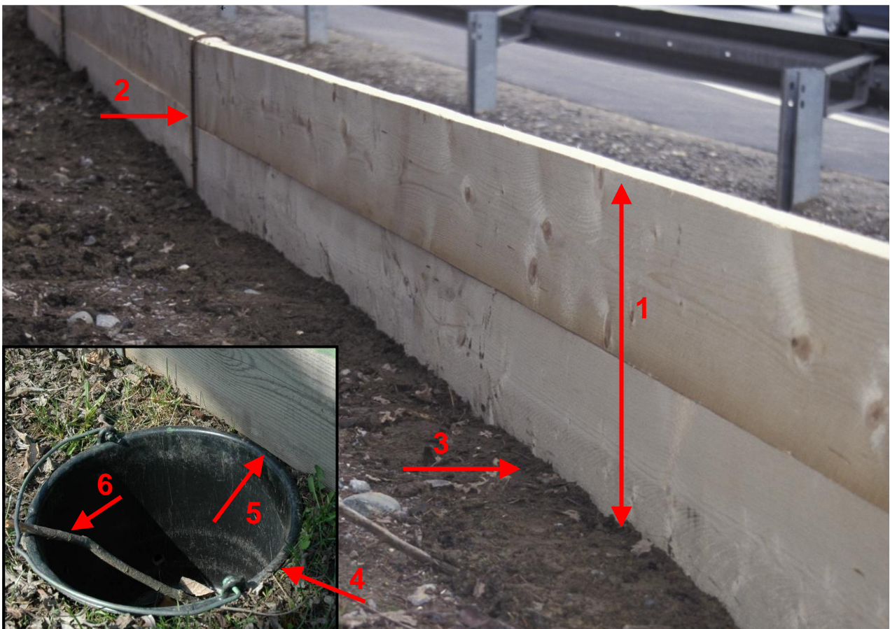
Abb. 1: Funktionsfähiger Bretterzaun zum Schutz wandernder Amphibien.

1 - Mindesthöhe 40 cm, 2 - lückenlose Verbindung der Bretter, 3 - Brett ist zum Boden dicht, 4 - Kübel ist ebenerdig eingegraben, 5 - Kübel ist direkt am Zaun eingegraben, 6 - Ast im Kübel (Foto: K. Smole-Wiener/Arge NATURSCHUTZ, 3.4.2012, Sonnegger See)